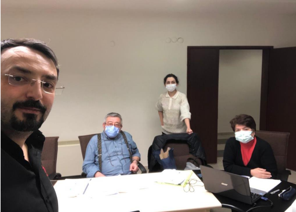
Resim -1 Bölüm Kalite toplantısı No:3